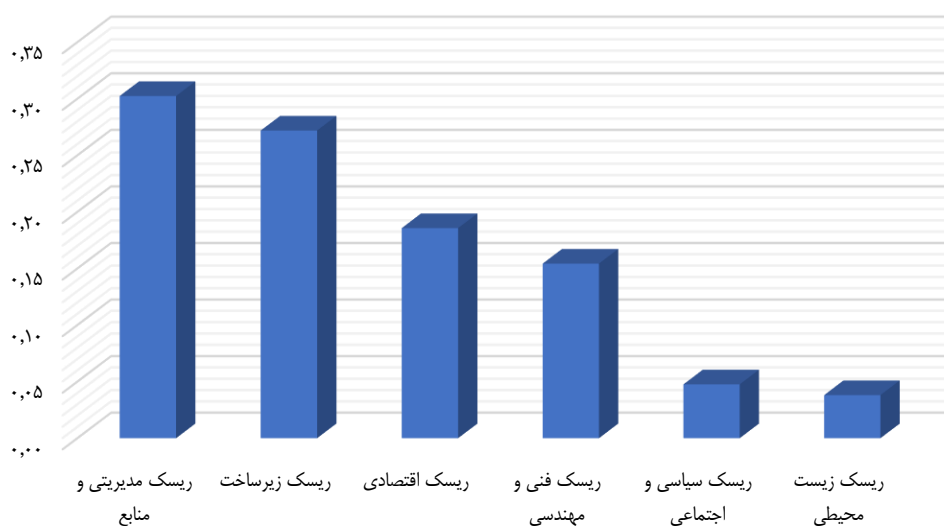
شکل ۲. وزن معیارهای اصلی

در ادامه به رتبه‌بندی ریسک‌های اصلی بر اساس وزن نهایی پرداخته می‌شود. با توجه به شکل ۲، در بین معیارهای ریسک‌های اصلی، ریسک مدیریتی و منابع با وزن ۰/۳۰۲۴ رتبه اول را کسب کرده است. ریسک زیرساخت با وزن ۰/۲۷۱۹ رتبه دوم و ریسک اقتصادی با وزن ۰/۱۸۵۷ رتبه سوم را کسب کرده است.